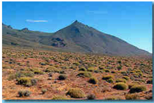
Figura 6: Estepa gramínea y arbustiva (Patagonia)

El dominio abarca un 12% de la superficie continental (sectores del interior Eurasia, Praderas medio oeste norteamericano y Patagonia, entre otros).