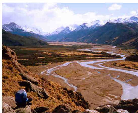
Figura 7: Patagonia Argentina