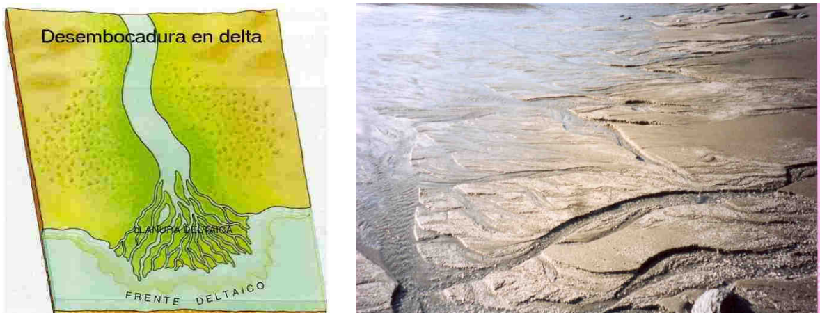
Figuras 3-4: Deltas