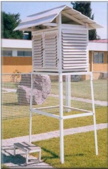
Figura 1 Garita meteorológica.

En una estación meteorológica, la garita de instrumentos, que se muestra en la figura 1, es una caseta pintada de blanco, con paredes de celosías a manera de persianas, que permiten la circulación libre del aire y protege los instrumentos del Sol, la lluvia, el viento, polvo, etc. El fondo de la caseta esta formado por un doble piso de madera, para evitar el calor directo desde la tierra, se ubica a 1.5 m del suelo. La configuración de la garita es estándar en todo el planeta. En la actualidad los instrumentos en el interior de la garita que se muestran en la figura 2, ya casi no se usan, y han sido reemplazados por estaciones meteorológicas automáticas, como la que se muestra en la figura 3.