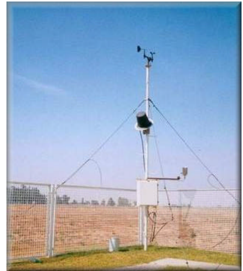
Figura 3. Estación meteorológica automática

Idealmente, la estación meteorológica debe estar situada en un lugar verdaderamente representativo de las condiciones naturales de la agricultura o silvicultura de la región de que se trate. Se deben evitar las zonas sometidas al drenaje de aire frío, cercanas a las charcas o zonas pantanosas, especialmente si estas tienen carácter temporal, o emplazamientos sometidos a frecuentes roces o inundaciones. Las observaciones de una estación normalizada de referencia deben ser comparadas con las de otros emplazamientos próximos, con objeto de obtener las diferencias cuantitativas del régimen climático local.