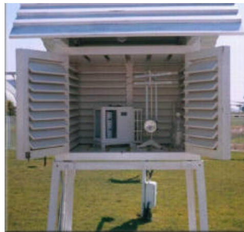
Figura 2. Interior de la garita meteorológica.