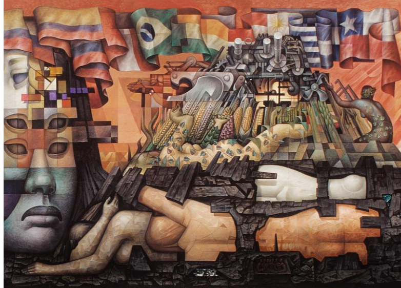
Extracto del mural de Jorge González Camarena "Presencia de América Latina", pintado entre 1964 y 1965 en la Universidad de Concepción.