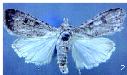
FIGURA 2. Adulto de H. polymorpha Forbes.