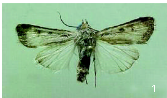
FIGURA 1. Adulto de H. conchidia Butler.